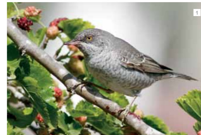
1 סבכי נצי. סבכי גדול ונדיר יחסית אצלנו, מזכיר את הנץ בעיניו הצהובות ובפספוס הרחבי על חלקו התחתון של גופו. עם השלמת התטולה נוהג הזכר לעזוב את הנקבה שבחרה בו, והוא משקיע את מרצו בחיפוש אחר נקבות חדשות.

מתחילת המאה ה-17 נכחדו כשמונה תת-מינים, ומין אחד המכונה סבכי אמריקאי ע"ש בצ'מן (Bachman), אם כי נוספו למשפחה תת-