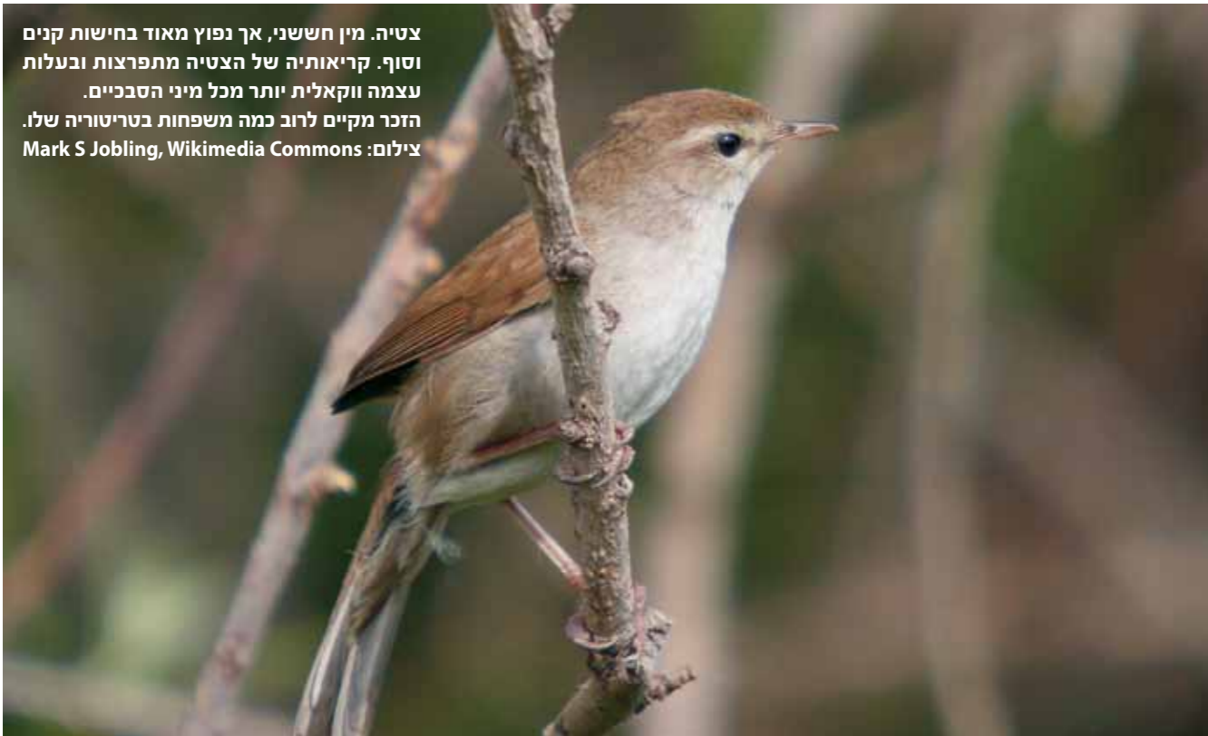
צטיה. מין חששני, אך נפוץ מאוד בחיטות קנים וסוף. קריאותיה של הצטיה מתפרצות ובעלות עצמה ווקאלית יותר מכל מיני הסבכיים. הזכר מקיים לרוב כמה משפחות בטריטוריה שלו. צילום: Mark S Jobling, Wikimedia Commons

2 קנית אירופית. מהמינים הגדולים בעולם הסבכיים. הקנית ניזונה גם מראשנים של צפרדעים. במחקר נתגלה כי הנקבות נמשכות בבירור לזכרים הראשונים שמגיעים מנדידתם לתפוס נחלות. צילום: חיים מויאל 3 תפר. דומה לפשוט, אך זנבו קצר יותר. פעיל ומקנן בשטחי תבואה פעמיים בשנה, שם הוא בונה על הקרקע את קנו המיוחד, העשוי עלים אשר אותם הוא תופר (כשמו) באמצעות קורי עכביש. צילום: חיים מויאל