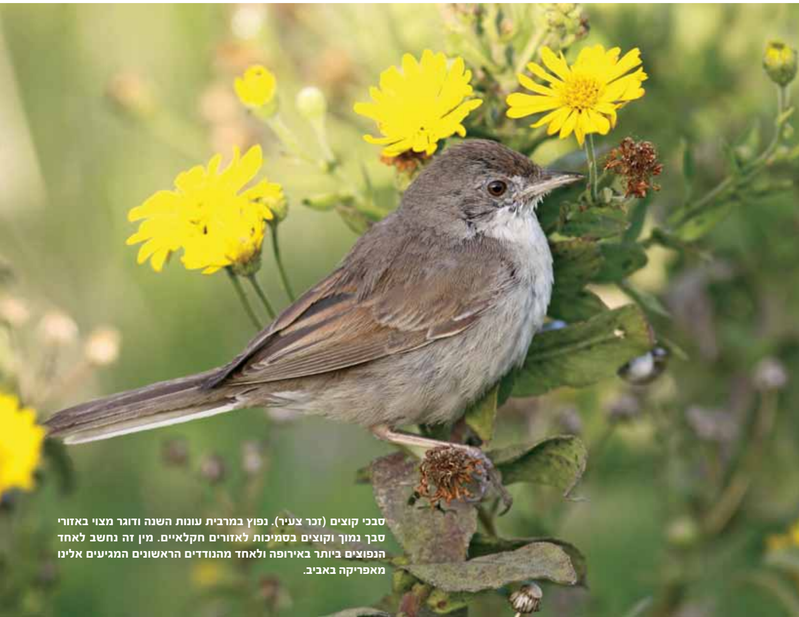
סבכי קוצים (זכר צעיר). נפוץ במרבית עונות השנה ודוגר מצוי באזורי סבך נמוך וקוצים בסמיכות לאזורים חקלאיים. מין זה נחשב לאחד הנפוצים ביותר באירופה ולאחד מהנוודים הראשונים המגיעים אלינו מאפריקה באביב.