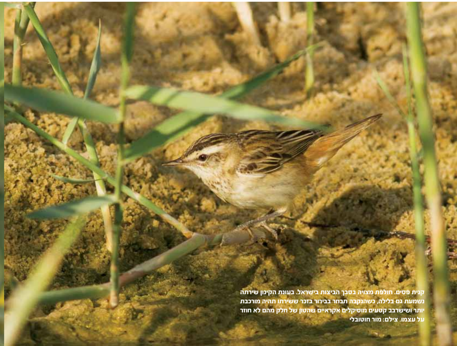
קית פסים. חולפת מצויה בסבך הביצות בישראל. בעונת הקינון שירתה נשמעת גם בלילה, כשהנקבה תבחר בבירור בזכר ששירתו תהיה מורכבת יותר ושישרבב קטנים מוסיקלים אקראיים שהטון של חלק מהם לא חוזר על עצמו.

מינים אחרים (ההפרדה לתת-מינים מתקיימת לרוב בבדיוד גאוגרפי של אוכלוסיות אזוטריות, ובמקרים מסוימים הם יהפכו אף למינים נפרדים).