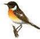
דוחל שחור גרון

מי שעוד מגיע בשבועיים האחרונים של אוקטובר לארצנו לבלות פה את החורף זה הדוחל שחור גרון.