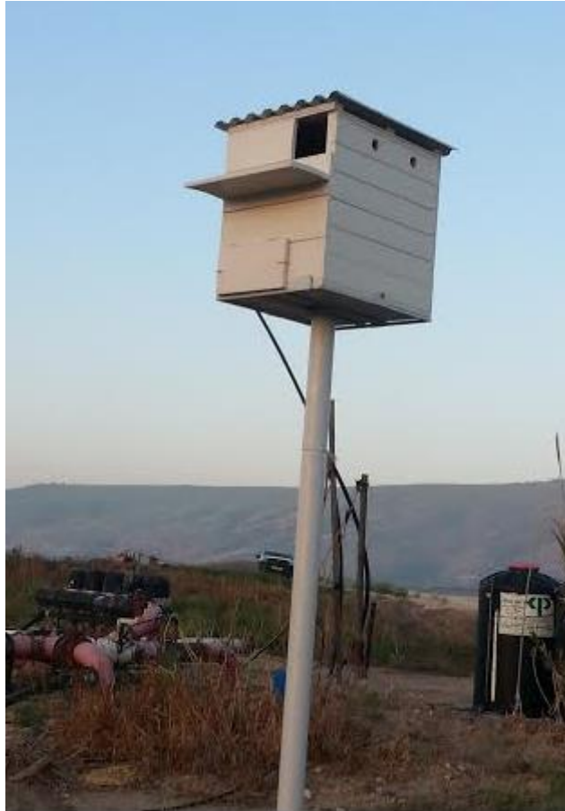
תיבת קינון אנגלית.

בתיבה האנגלית, מהמודל החדש, פתח הכניסה לתיבה מצוי גבוה, בסמוך לתקרה. המבנה שלה פשוט – תא אחד גדול, ללא תא הטלה וללא מחיצה לכיוון יציאה כמו בתיבות ישנות. חשוב להשתמש בעץ מלא ולצבוע אותו בצבע שמן או שמן עץ, שיגן על העץ.